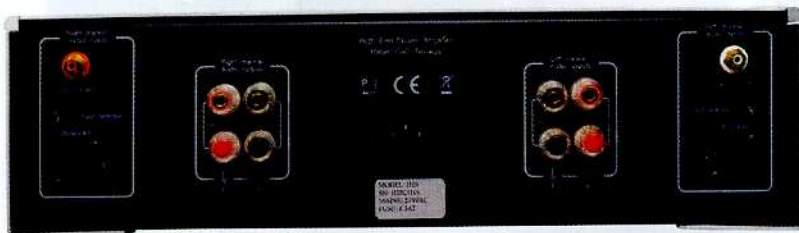
La face arrière laisse présager la structure totalement double mono du H20. Tout est symétrique par rapport au connecteur IEC central.

Scène sonore : Les bases sont solides, et l'image peut donc s'émanciper librement, se construire et se poser en confiance. Le H20