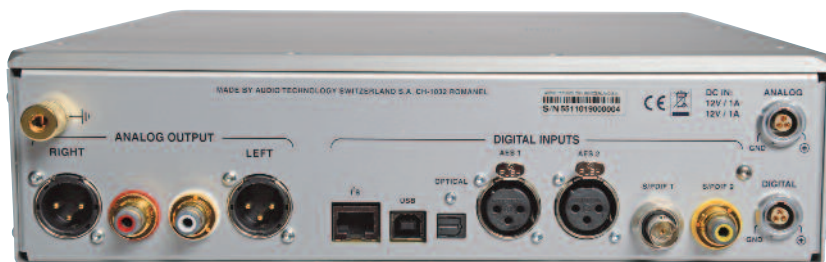
Les deux fiches Lemo à droite reçoivent les alimentations du châssis MPS.

Médium : Aucun détail n'a disparu à l'écoute de chacune de nos pistes repères, et le HD DAC est tout sauf avare dans ce domaine des détails. Non, c'est simplement dans la façon de les reproduire tous ensemble qu'il tranche avec tout, absolument tout ce que nous avons entendu jusqu'à présent. Ne vous méprenez pas, ce « simplement » qui symbolise l'évidence avec laquelle le HD DAC fait couler la musique cache en réalité des heures et des heures de travail de la