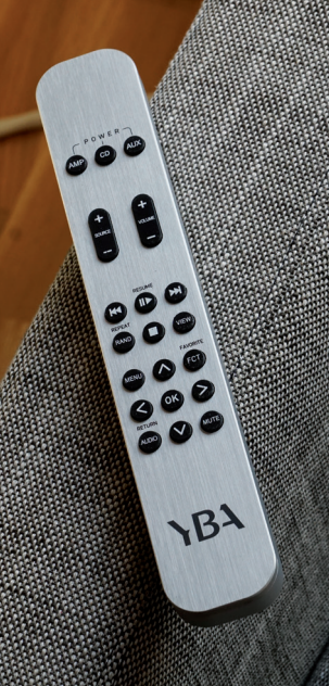
Full metal remote !